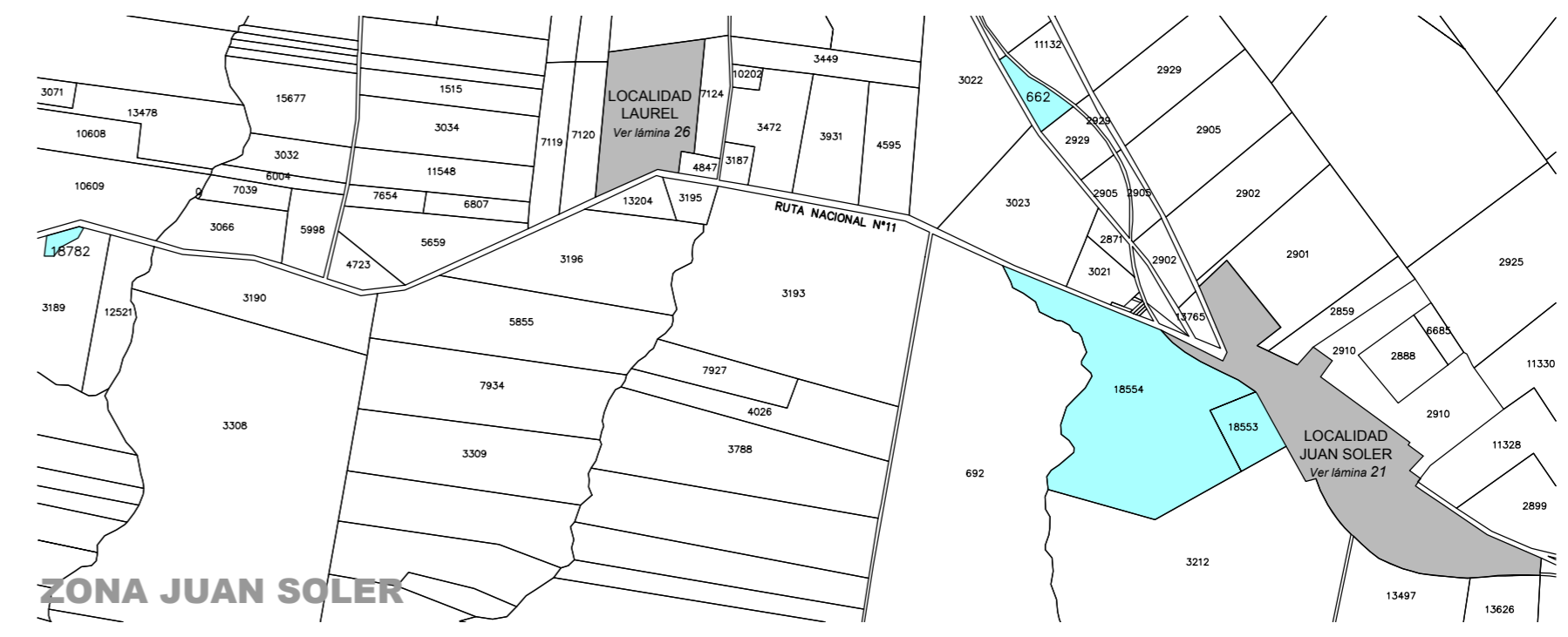
ZONA JUAN SOLER